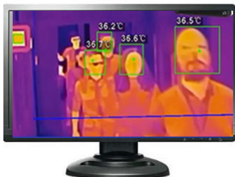
27インチ監視用モニタ